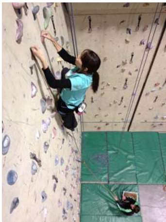
寒くても頑張ってます！

今までは怖くて垂壁（主に2、3番壁）でしたが、少しずつ4番壁以降のルートにもTRYしていきたいです。